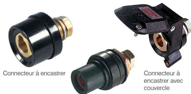
Connecteur à encastrer