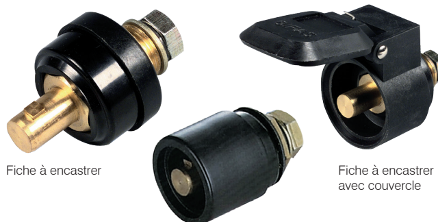
Fiche à encastrer